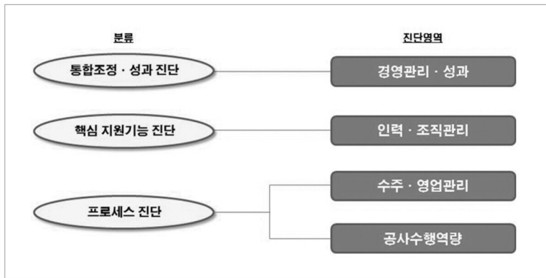
〈그림 1〉 중소 건설업체 경영 진단의 기본 원칙과 주요 항목

성장성을 우선적으로 고려해야 한다. 넷째로, 시장 내에서의 경쟁 우위를 갖고 있는지에 초점을 맞추어야 한다. 중소기업의 활동 분야는 신규 진입이 용이하고 과당 경쟁이 있으므로 시장 내에서 중소기업으로서의 경쟁력을 갖추고 있는지 신중하게 고려해야 한다.